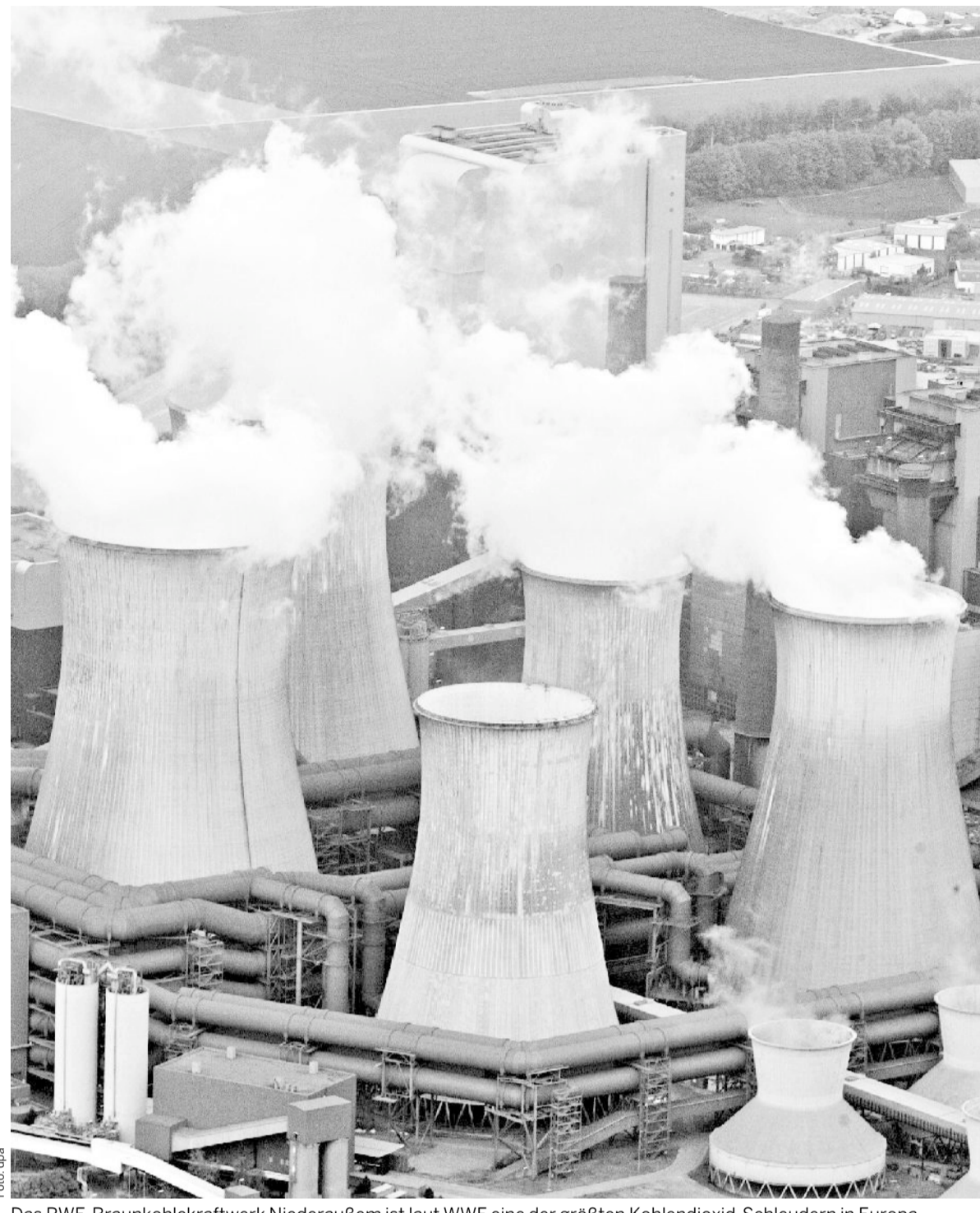
Das RWE-Braunkohlekraftwerk Niederaußem ist laut WWF eine der größten Kohlendioxid-Schleudern in Europa.